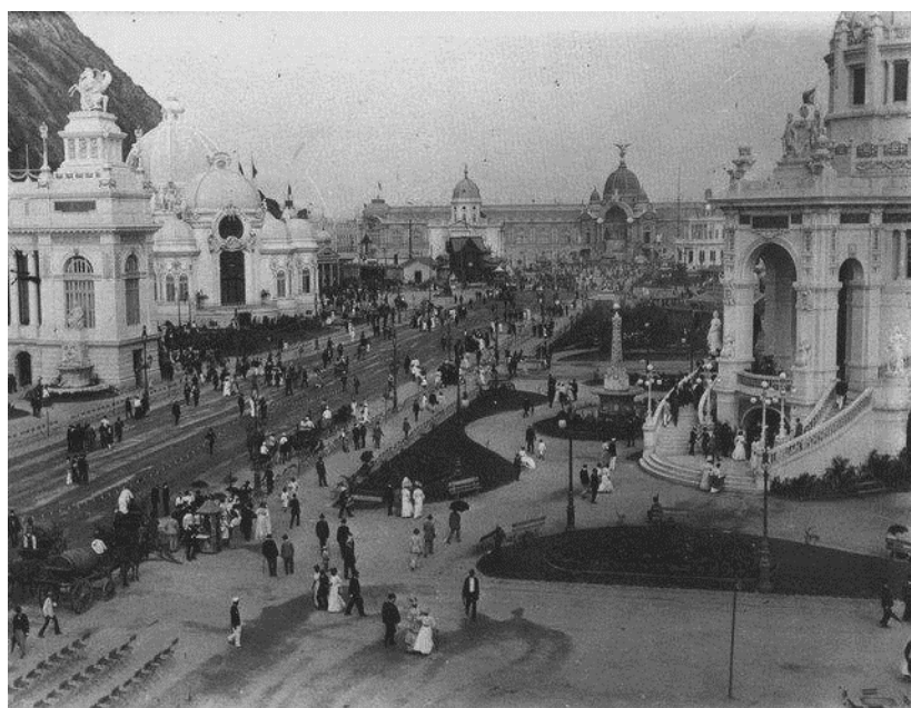
Figura 1: Fotografia panorâmica da Exposição Nacional de 1908. À esquerda observam-se os Pavilhões de Minas Gerais e de São Paulo; à direita, o Pavilhão da Bahia. Ao fundo, pode ser visto o Palácio das Indústrias tendo a sua frente, na esquerda, o Pavilhão da Sociedade Nacional de Agricultura e, à direita, o dos Correios e Telégrafos. ( http://rioantigo.multiply.com/photos/photo/6/171.jpg , acessado em 30 de maio de 2006)

Não se tratava de uma novidade já que, a partir da Exposição Universal de Londres, de 1862, o Brasil se fazia representar nas principais Exposições Internacionais, eventualmente como convidado, além de promover a Primeira Exposição Nacional em 1861, preparatória àquela do Reino Unido (Pesavento, 1997). Mas sendo esta a primeira a ocorrer nos tempos da República, isto lhe configurava um significado de extrema importância. A propaganda do Brasil ao mundo deveria não só mostrar a riqueza da natureza do país, como o seu potencial produtivo e o seu grau de civilização, representados pelos seus produtos primários, seus manufaturados, pelos avanços das ciências e representações artísticas.