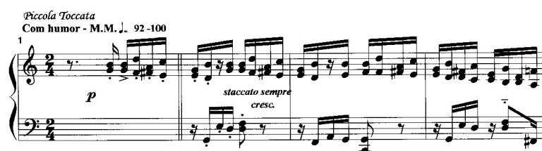
Ex. 2.1. Bocchino, Sonatina para Piano , Mov. I (cc. 1 – 4) – Início da Introdução

O primeiro movimento da Sonatina possui caráter predominantemente rítmico. A manutenção do desenho rítmico inicial, com unidade de tempo subdividida em quatro pulsos iguais, andamento rápido e em contratempo com a voz inferior, estabelece um moto-perpétuo bem característico de uma Toccata , o que justifica a denominação Piccola Toccata indicada pelo próprio compositor junto ao andamento (ex. 2.1).