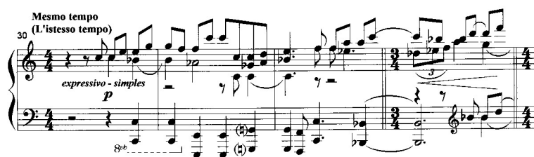
Ex. 2.2. Bocchino, Sonatina para Piano , Mov. I (cc. 30 – 33) – Início da Seção 3

Esse movimento inicial é construído a partir de seis motivos básicos (Tab. 1).