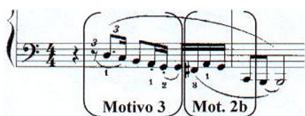
Ex. 4.1. Bocchino, Sonatina para Piano , Mov. III - Célula inicial

Já na Introdução, a célula inicial provém do primeiro movimento (ex. 4.1), porém apresenta o Motivo 3 ritmicamente modificado e o Motivo 2b com variação intervalar. Em toque legato , esses Motivos assumem caráter melodioso, expressivo.