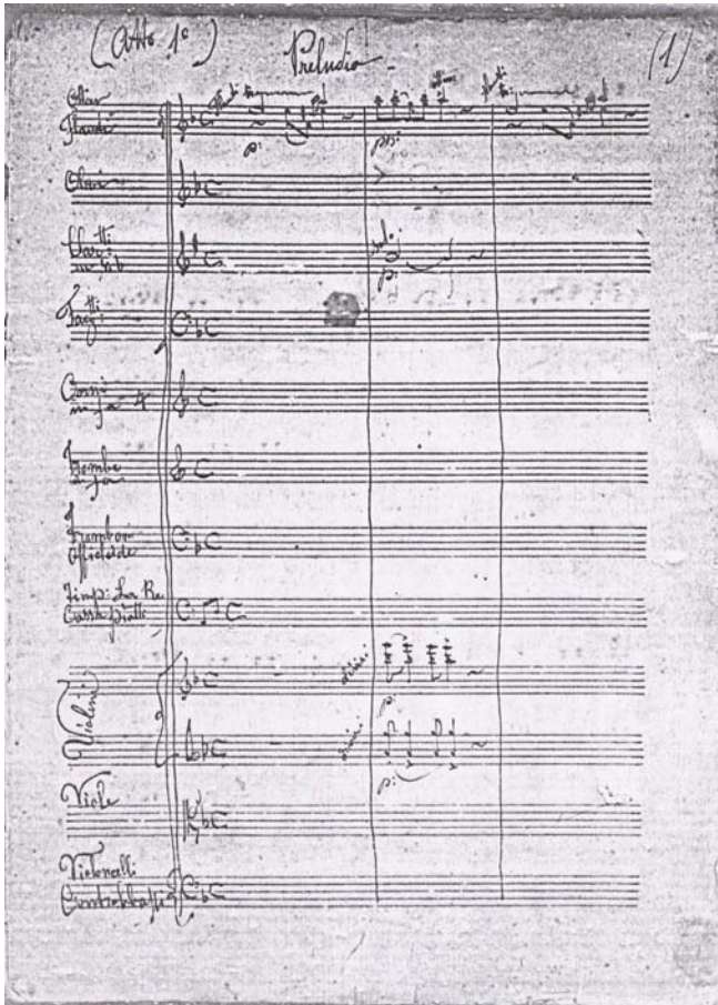
Figura 1: Prelúdio da ópera La croce d'oro , pág 1

Composta em 1872, é uma ópera em 3 atos, com 237 páginas, da qual fazem parte seis personagens principais – 2 sopranos, 1 mezzosoprano, 1 tenor, 1 barítono e 1 baixo – e coro (SATB). A orquestra está formada por otavino, flautas, oboés, clarinetes em si b , fagotes, trompas em fá, trombone em fá, trombone baixo (officleide), harpa, tímpanos (lá e ré), caixa, pratos, violinos, violas, violoncelos e contrabaixos.