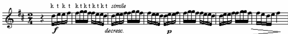
Figura 8: Lamento , variação em golpe duplo, comp. 42 a 45.

Um dos problemas na emissão do golpe duplo ocorre quando a articulação soa com o k mais fraco que o t . Wye (WYE, 1979, p. 24) recomenda exercitar a passagem iniciando o golpe duplo com k , colocando acentos em todos os ks . É possível, ainda, criar variações na passagem, duplicando as notas cuja emissão seja mais difícil, como no exemplo abaixo (figura 8), construído a partir da versão de Carrilho sobre Lamento .