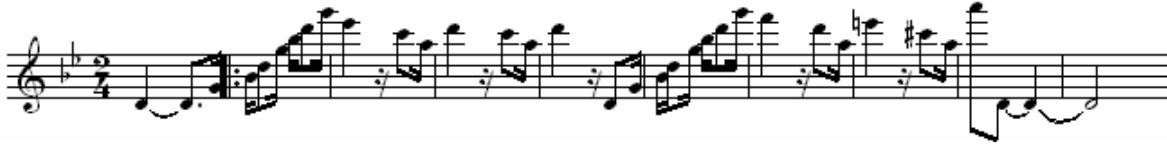
Figura 1: André de Sapato Novo , de André Victor Corrêa, comp. 01 a 10.

O registro grave na flauta exige um trabalho de sonoridade cujo resultado só se colhe com tempo e amadurecimento. Os sons graves são naturalmente menos potentes na flauta e, para equipará-los aos sons das demais oitavas, há que se agir segundo um conjunto de estratégias. Uma dessas estratégias envolve pesquisar quanto do orifício do bocal cobrir para que o som não fique nem muito cheio de ar (orifício muito aberto) nem falho (orifício muito fechado). A tendência na região grave é cobrir demais o orifício, já que é necessário direcionar o ar para dentro do tubo. No entanto, se o orifício for coberto excessivamente, os ataques das notas graves tendem a falhar, o que termina por eliminar o som grave por completo.