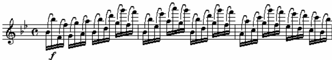
Figura 7: Andersen, op. 30, 21, comp. 1 a 3.