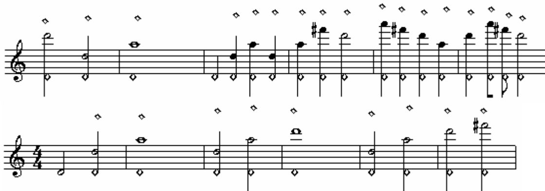
Figura 2: Exercício de harmônicos sobre o André de Sapato Novo , de André Victor Corrêa

Recomenda-se, a flautistas de todos os níveis técnicos, a prática de sons harmônicos. Eles podem ser exercitados a partir das notas dó3 , ré3 e mib3 do registro grave, buscando alcançar cada som harmônico com exatidão, o que exige um cuidadoso estudo da pressão de ar e da embocadura. Sugere-se uma aplicação do estudo de Harmônicos (figura 2), para o trecho do André de sapato novo , utilizando a nota ré3 (WYE, 1979, p. 06).