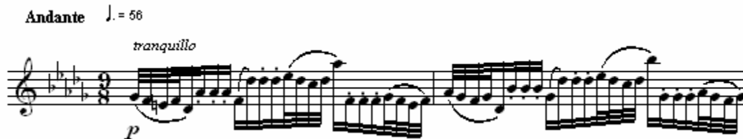
Figura 11: Andersen, op. 30, 15, comp. 01 e 02.