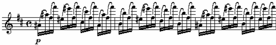
Figura 6: Boehm, op. 26, 22, comp. 9 a 11.

A seguir, alguns exemplos de estudos que envolvem intervallos de oitava (Figuras 6 e 7):