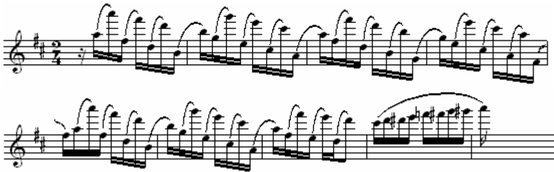
Figura 5: Língua de Preto , de Honório Lopes, comp. 01 a 08.

A seguir, alguns exemplos de estudos que envolvem intervallos de oitava (Figuras 6 e 7):