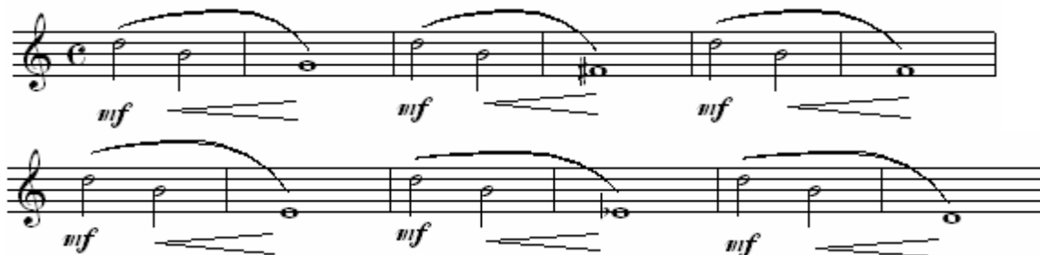
Figura 4: Exercício para intervalos de oitava descendentes.

Esse trecho é especialmente problemático, porque a figuração rítmica determina que a nota grave soe por pouco tempo (trata-se de semicolcheia), o que exige grande precisão na execução da nota. A respeito, recomenda-se que, como exercício, o intervalo de oitava seja subdividido em intervalos menores (por exemplo, de terça e de quinta, conforme figura 4). Dessa forma, pode-se aperfeiçoar o movimento dos lábios e a mudança no direcionamento do ar, gradualmente, até que se ajustem à execução da oitava (WYE, 1979, p.12).