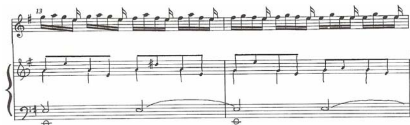
Figura 2: compasso 13 Fonte: Kirchner

Apenas trocando-se o acorde segundo a cifragem, sem mesmo quebrá-lo, arpejando-se em pontos estratégicos como, por exemplo, o primeiro tempo dos compassos 5 e 8, já se terá um acompanhamento com movimentação suficiente, sem no entanto comprometer o desenho em semicolcheias do violino. Neste caso, o arpejo funcionaria como elemento gramatical, uma pontuação na frase, por exemplo. Possivelmente fique bem colocada uma realização um pouco mais ornamentada a partir do compasso 13, quando vão aparecer os acordes de nona, ou um acompanhamento em colcheias como sugerido por Kirchner (fig. 2).