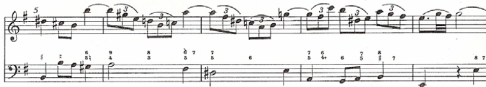
Figura 5 c) : compassos 5 a 9.

No contexto cromático deste Adagio ma non tanto , existe uma passagem característica que se repete algumas vezes, a saber, a descida de meio tom do baixo e da linha melódica, como acontece, por exemplo, nos compassos 18 e 19. Acompanhada da cifra 7 5 6 7, chama a atenção por especificar um movimento melódico para a realização. Convém notar que, embora não haja indicação na cifra, a sexta ao final do segundo tempo do compasso 19 leva um sustenido, pois não poderia continuar com o Fá bequadro do primeiro tempo (fig. 6). É plausível a realização de uma evolução preparando o segundo e o terceiro tempo do compasso 17, preenchendo a pausa do violino e ligando o acompanhamento á nova entrada do solo.