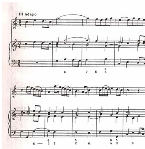
Figura 4: trecho da sonata de Albinoni realizada por Gerber. Fonte: Christensen (1994, p.102).

No primeiro compasso do exemplo anterior, seria possível reatacar a sétima (Dó) no segundo tempo, a fim de evitar as oitavas diretas entre o solo e o acompanhamento (Sol- Fá #- Si). Nota-se que na realização acima foi necessário inserir uma seqüência de notas de passagem no final do compasso 11, a fim de fornecer a devida preparação para o acorde de sétima no primeiro tempo do compasso 12. Como recomendado na segunda parte dos Princípios e Preceitos... , regra 1, quando a sétima aparece sozinha, deve ser preparada. Quanto à opção de colocá-la na voz superior, dobrando a linha do solista por um compasso, ao invés de utilizar a nota Mi das vozes de contralto e tenor como preparação, justifica-se recorrendo ao exemplo da realização da Sonata em Lá menor para violino e baixo contínuo de Tomaso Albinoni, feita por H.N.Gerber (1746-1819) e com as correções de Bach. Como observado por Christensen (1994), a realização segue, em geral, o curso da voz solista, mas não por toda a peça, obedecendo a uma lógica interna própria de condução de vozes que cria uma melodia contrapontística, porém não solista (fig.4).